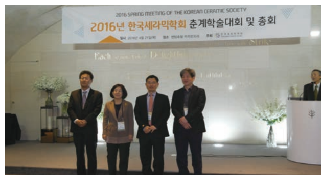
[세라미스트 밤 및 시상식]