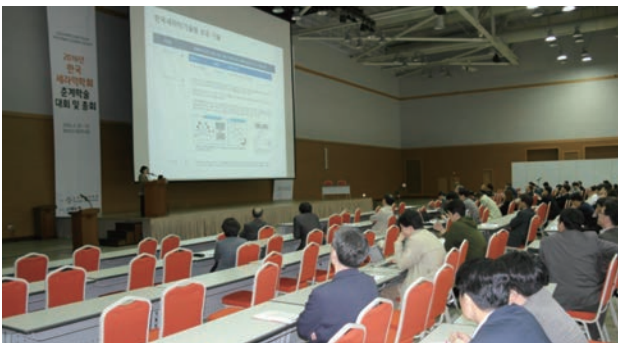
[세라믹 산학연 포럼]